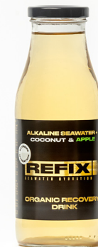
Manzana y coco