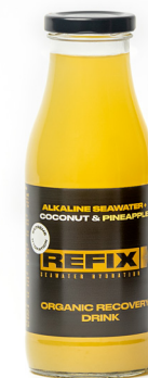
Piña y coco